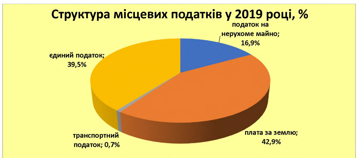
Рис. 4. Структура місцевих податків і зборів.

Основні джерела податкових надходжень протягом 2016-2020 років майже не змінні. Більше половини – це надходження ПДФО (65%), акцизний податок – 15%, місцеві податки і збори – 19,0% (рис. 4) і т.д.