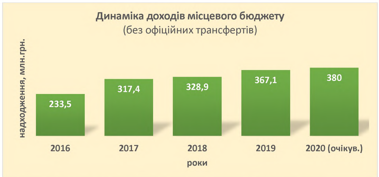
Рис. 3. Динаміка доходів бюджету Слобожанської ОТГ, млн.грн.

В розвиток громади вагомий внесок вносять юридичні особи та фізичні особи-підприємці, як сплачують податки до місцевого бюджету, зокрема, податок на доходи фізичних осіб, акцизний податок, місцеві податки і збори.